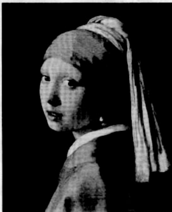
Jan Vermeer, Ragazza col turbante

E' online il primo numero del 2009 di "Amaltea. Trimestrale di cultura", giunto al quarto anno di edizione, interessanti le proposte di lettura: l'intervista al regista algerino Rachid Benhadj, un omaggio al futurismo di Depero, le riflessioni sul web di frontiera, tante recensioni, scritture originali, curiosità dalle rubriche La Lettura Scritta' e La finestra di Eupalino' e tanto altro ancora... vi proponiamo l'editoriale!